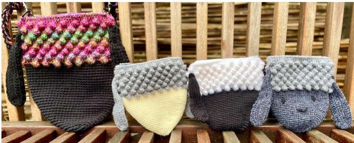
Die große Mähllinda wurde aus dickerem Garn gearbeitet.

©Anna Wessel 11.2.2024 Alle Inhalte dieser Anleitung, insbesondere Texte, Fotografien und Grafiken sind urheberrechtlich geschützt. Das Urheberrecht liegt, soweit nicht ausdrücklich anders gekennzeichnet, bei Anna Lena Wessel. Die Anleitung darf nicht verkauft werden. Sie dürfen nach der Anleitung hergestellte Gegenstände verkaufen, verweisen Sie hierbei bitte auf die Anleitung.